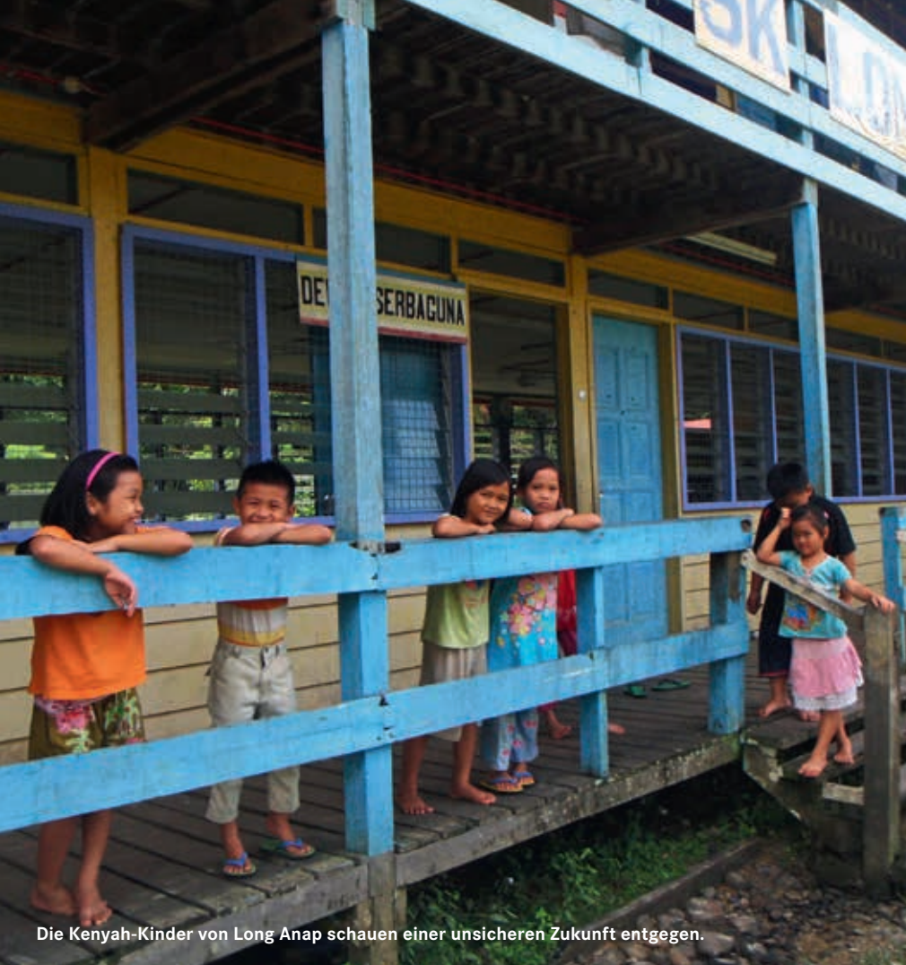
Die Kenyah-Kinder von Long Anap schauen einer unsicheren Zukunft entgegen.