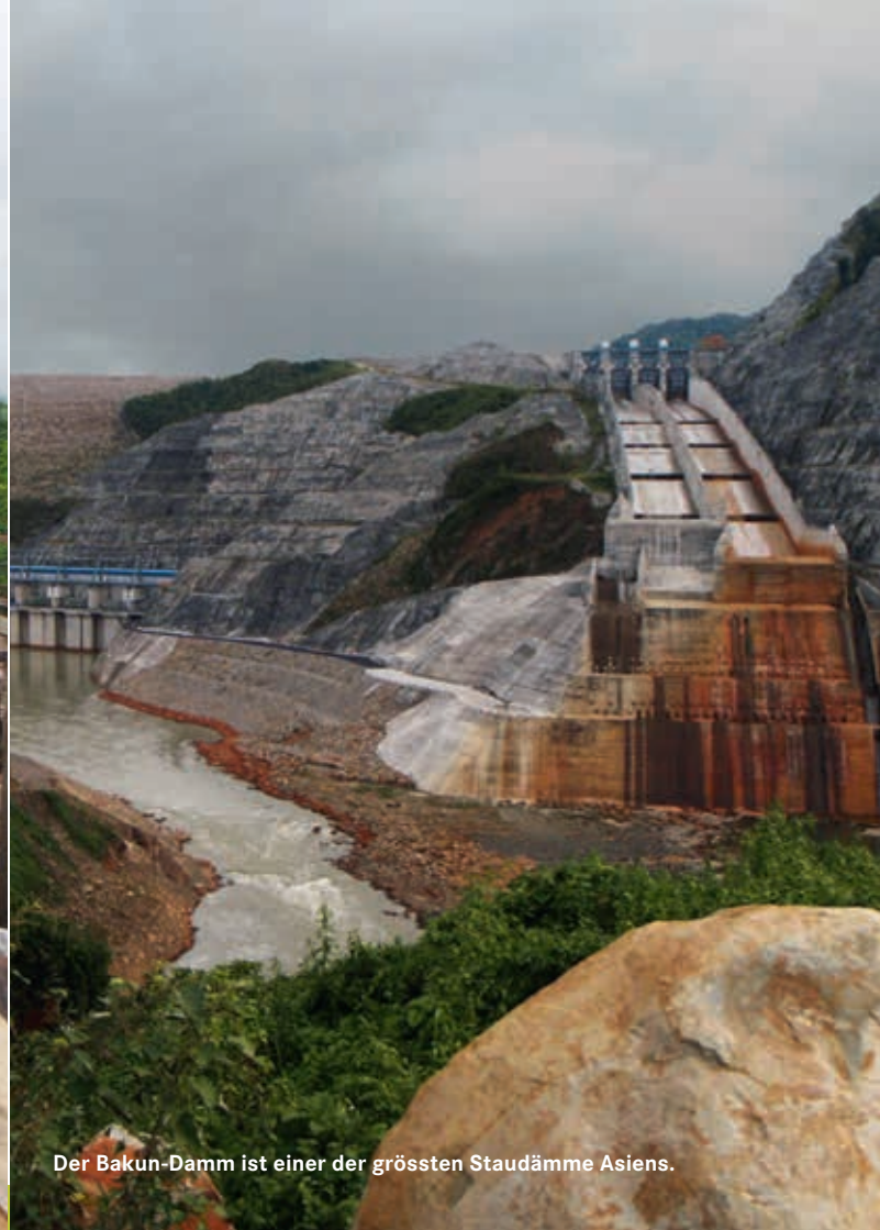
Der Bakun-Damm ist einer der grössten Staudämme Asiens.