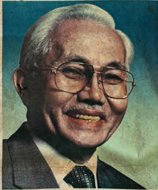
Y.A.B. Datuk Patinggi Tan Sri (Dr.) Haji Abdul Taib Mahmud