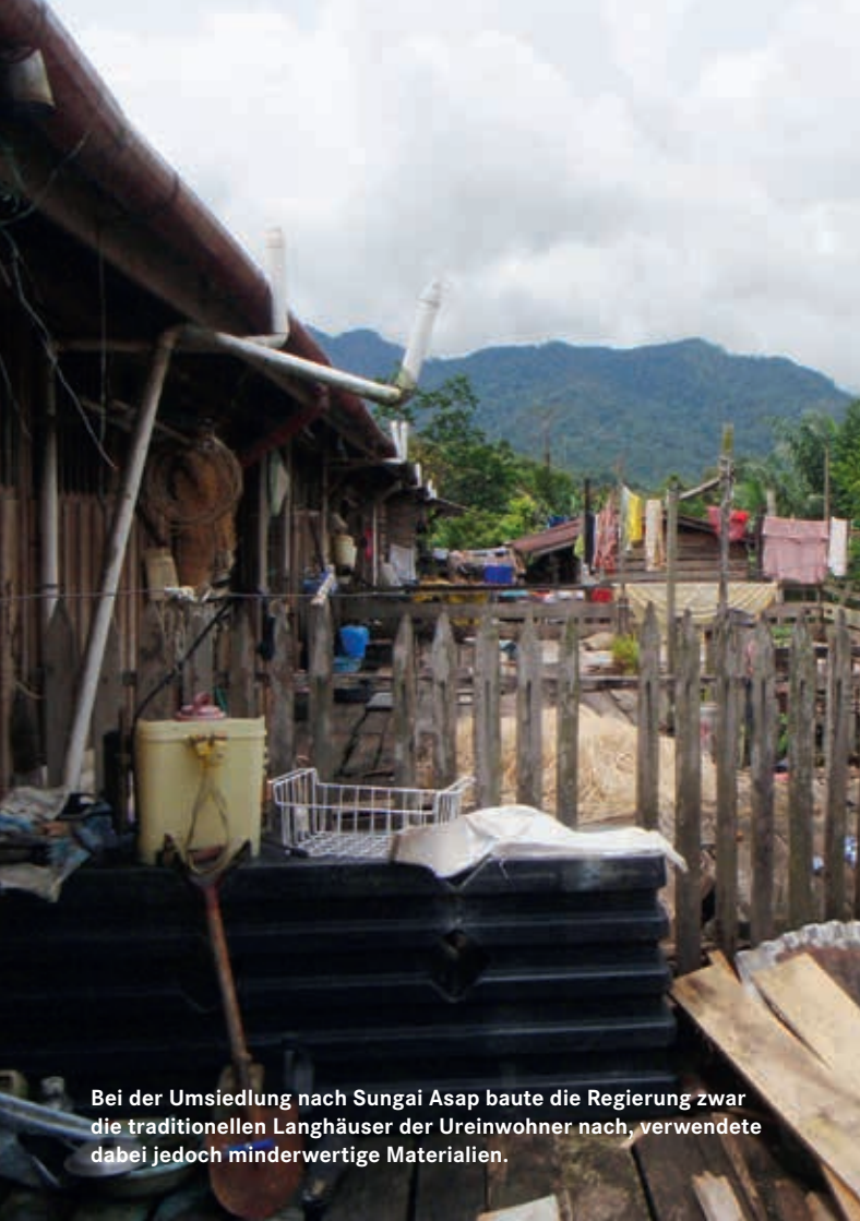
Bei der Umsiedlung nach Sungai Asap baute die Regierung zwar die traditionellen Langhäuser der Ureinwohner nach, verwendete dabei jedoch minderwertige Materialien.