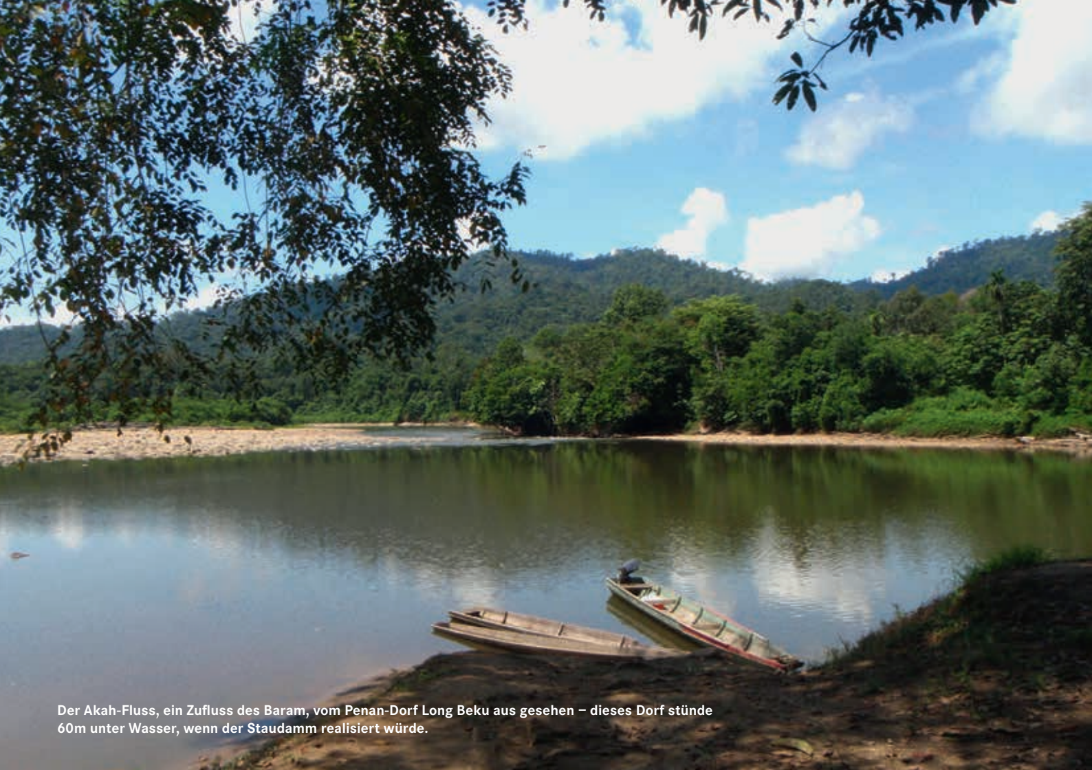
Der Akah-Fluss, ein Zufluss des Baram, vom Penan-Dorf Long Beku aus gesehen – dieses Dorf stünde 60m unter Wasser, wenn der Staudamm realisiert würde.